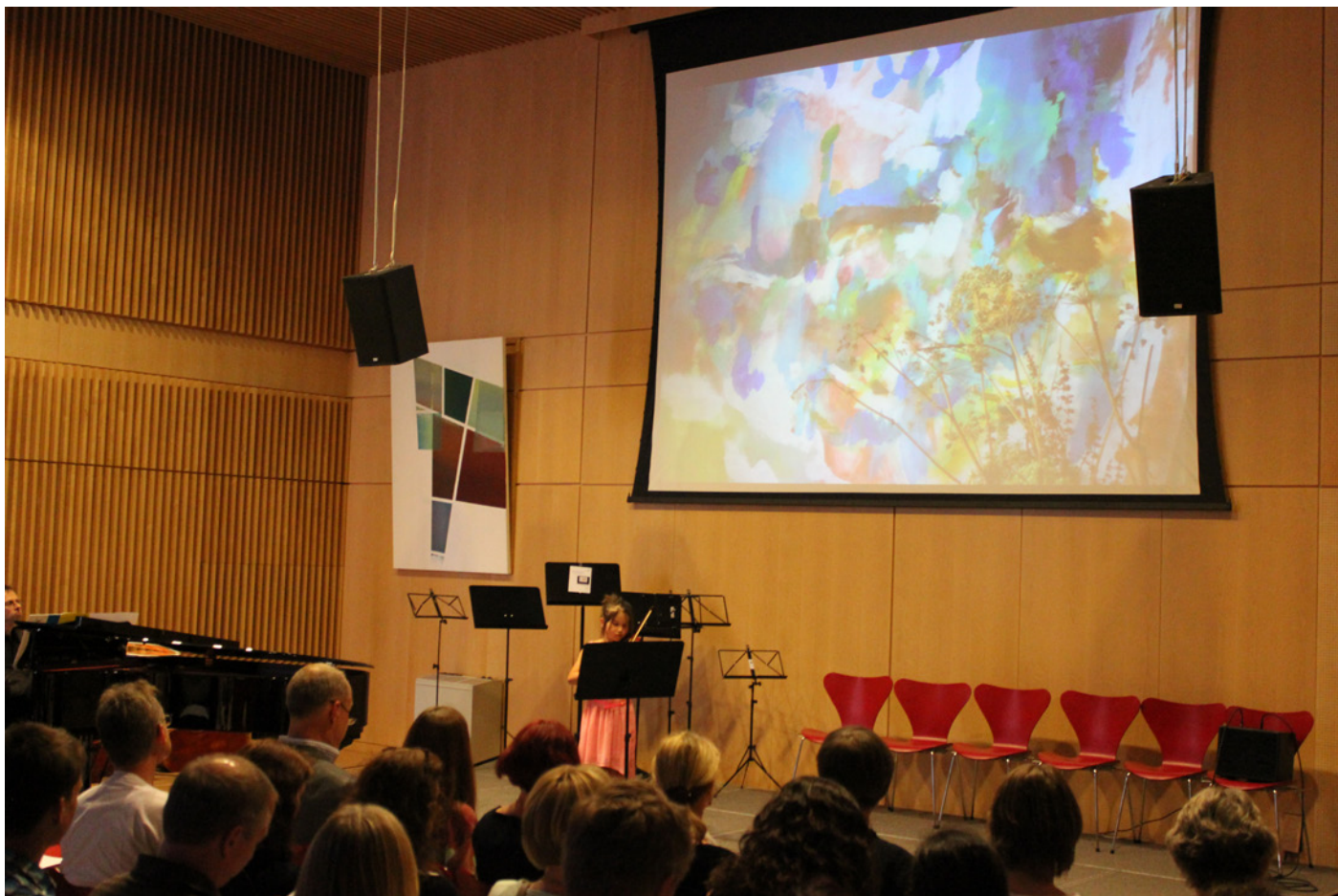
Kirsten Kötter: The Abstract Norway, 2012