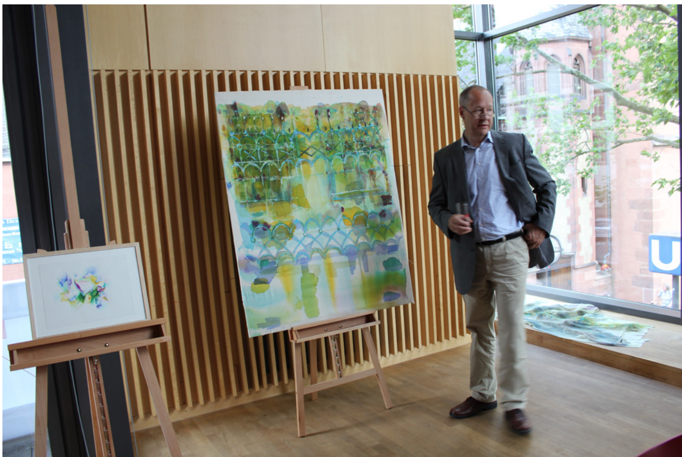
Christoph Hornbach / Kirsten Kötter: Most na Soci, 2004 und Gartenstadt Marokko, 2012