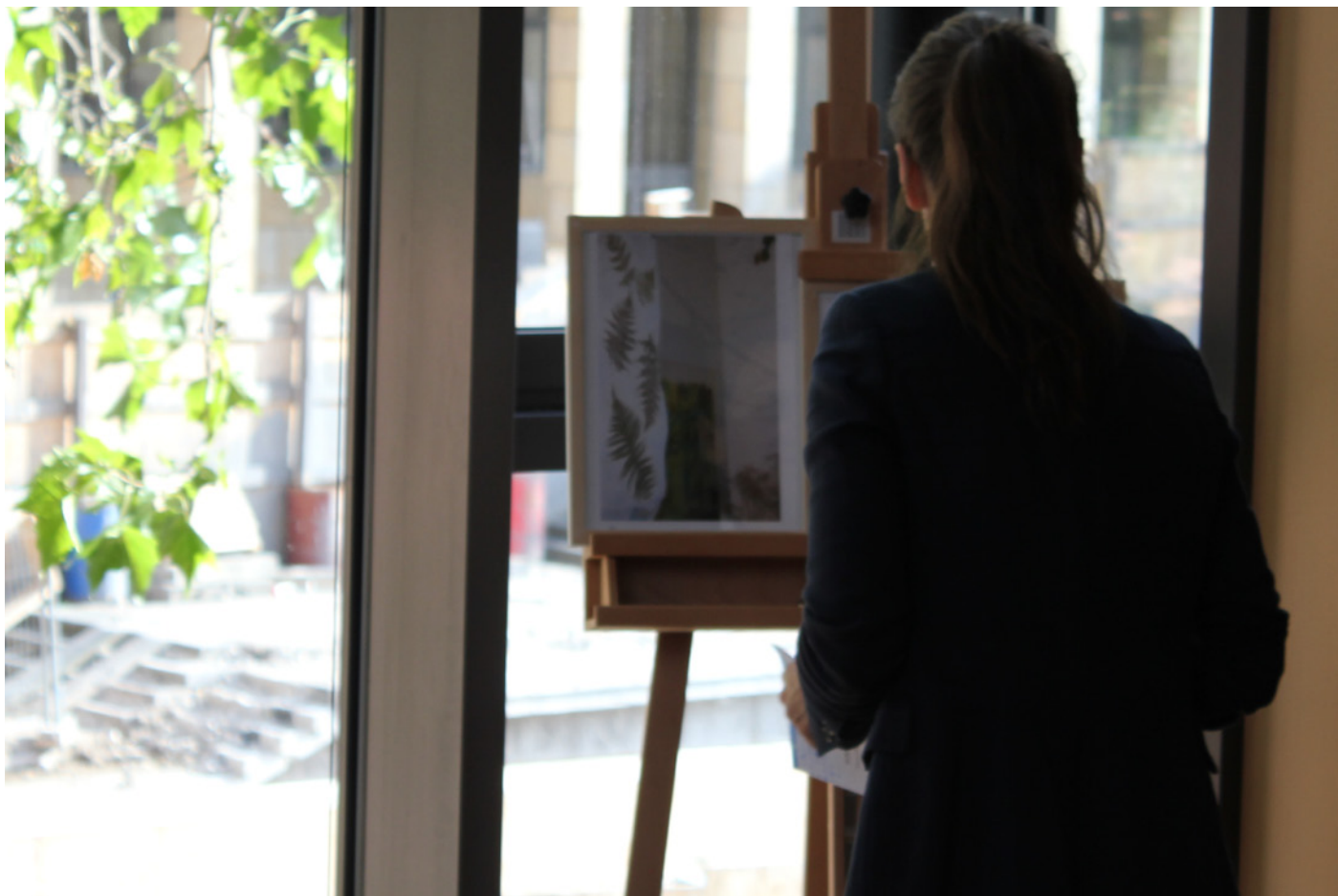
Publikum / Kirsten Kötter: Farn mit Licht, 2012