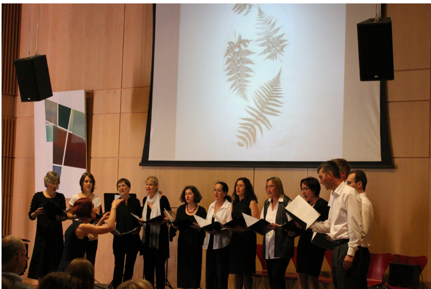
Kirsten Kötter: Farn mit Licht, 2012