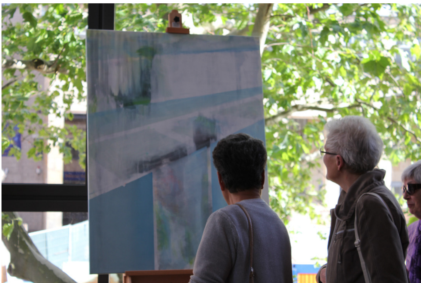
Publikum / Kirsten Kötter: ohne Titel (Palimpsest), 2007 / 2011