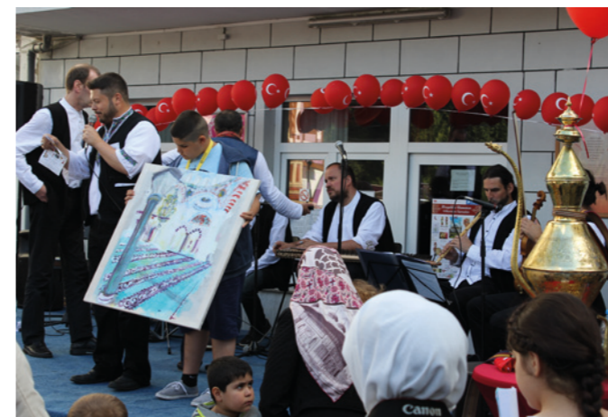
Sehitlik Moschee, Berlin, 2014 – 2015