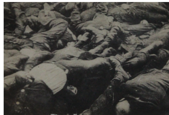
Das Konzentrationslager wurde auf dem Gelände des ehemaligen Gefängnisses während des Nationalsozialismus in Sonnenburg errichtet. Am 30.01.1945 wurden 800 Häftlinge kurz vor Ankunft der Roten Armee ermordet.