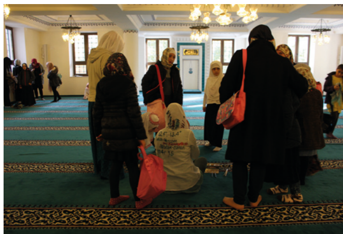
Sehitlik Mosque, Berlin, 2014 – 2015