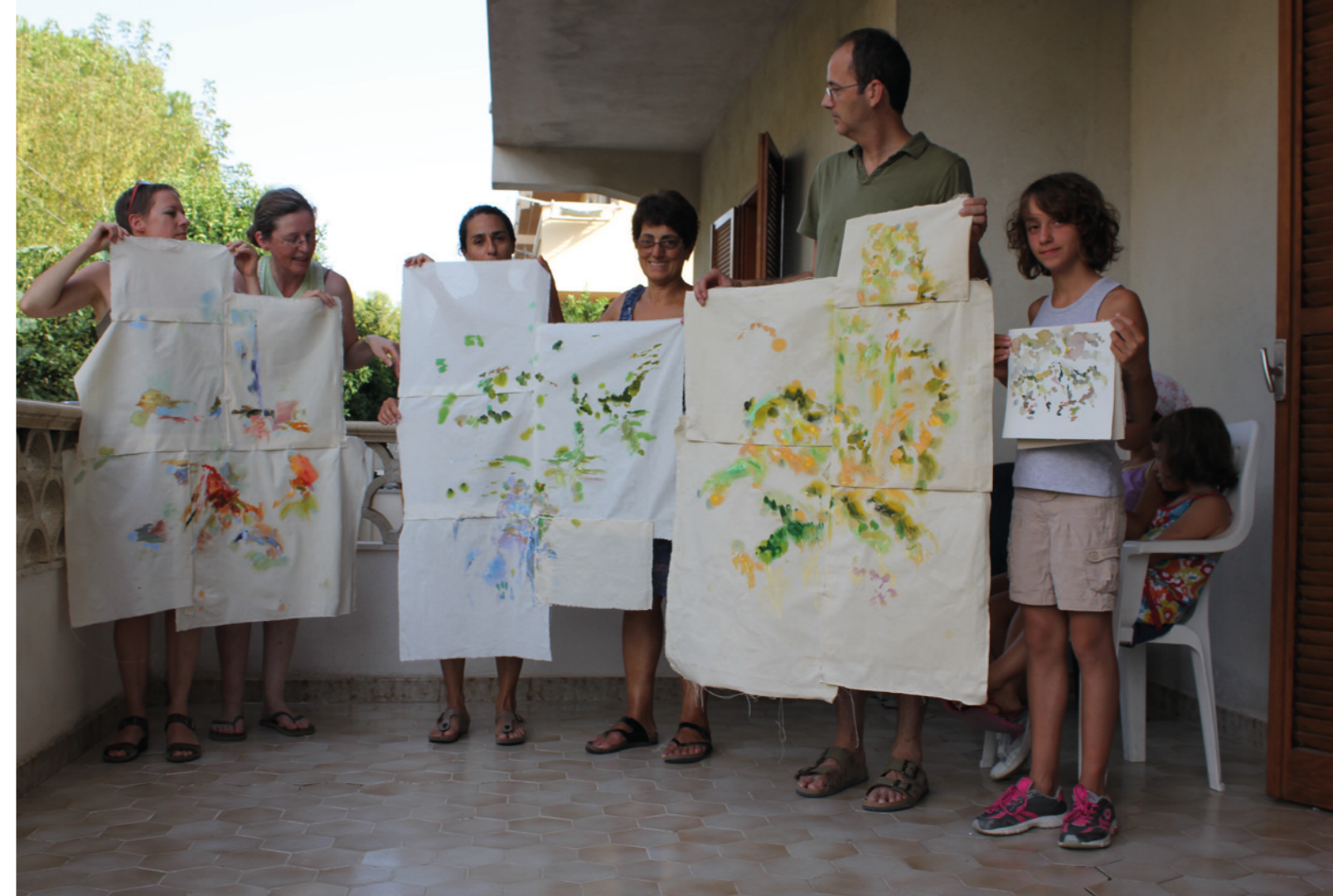
Pietrapaola Paese (Dorf) / Pietrapaola Marina (am Meer), Italien