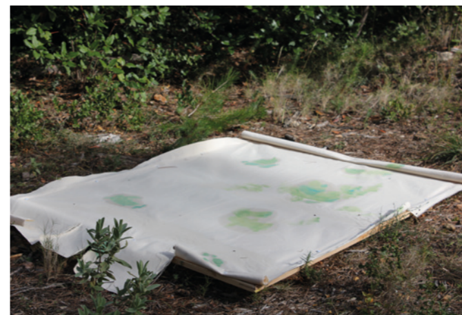
Site-specific Research nach Paul Cézanne. Cézanne malte in der Natur bei Aix-en-Provence. Er malte besonders häufig die Montagne Sainte-Victoire sowie im Steinbruch Bibémus.