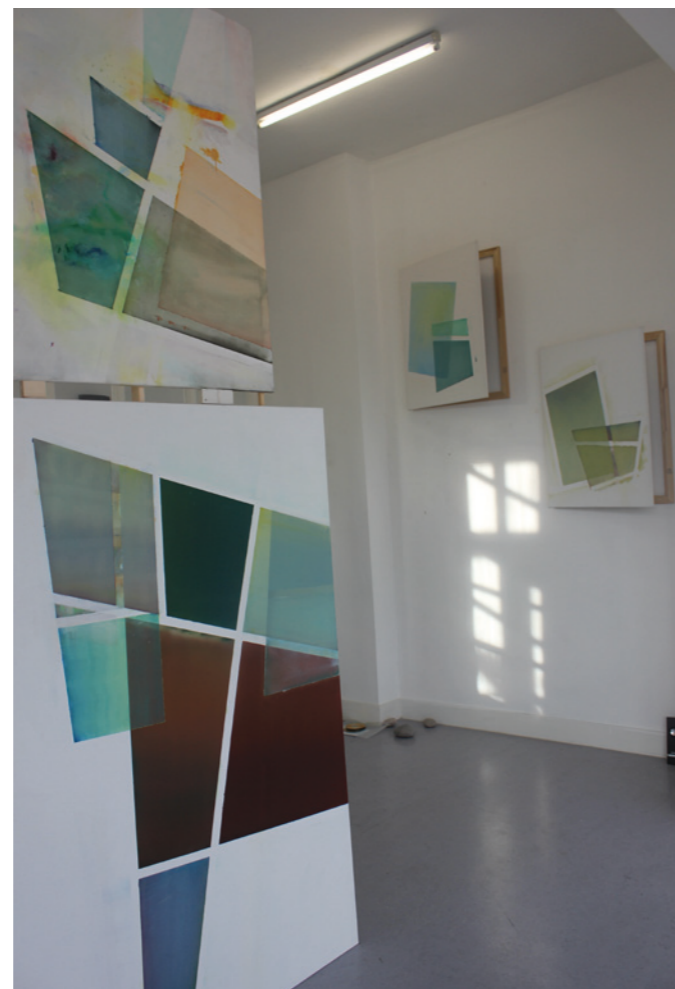
Exkurs: „Kunst als Architektur einer freien Gesellschaft.“ (Marcuse, 1967), Kunstfabrik Darmstadt, 2014

Stärke, denn sie konstituiert die Gesellschaft, der sie sonst nicht formbildend aber diese Äußerungen als 3.3.3 "Kunst als Architektur einer freien Gesellschaft" 1967 hatte Herbert Marcuse in einem Vortrag gesagt: "Nicht um politische Kunst als Architektur (es. 68) 1972, auf der Konferenz zur Kunsttheorie"