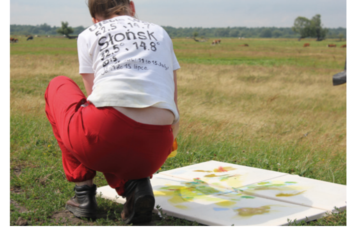
Nationalpark bei Slonsk, Polen, Juli 2015